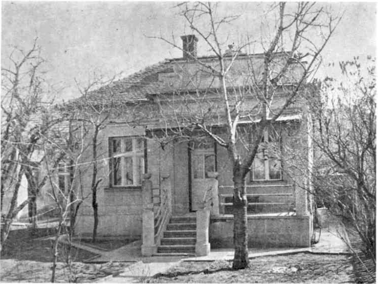
Зграда у Гарибалдијевој улици бр. 4 у којој је радио Покрајински комитет КПЈ за Србију у току 1942—1944.