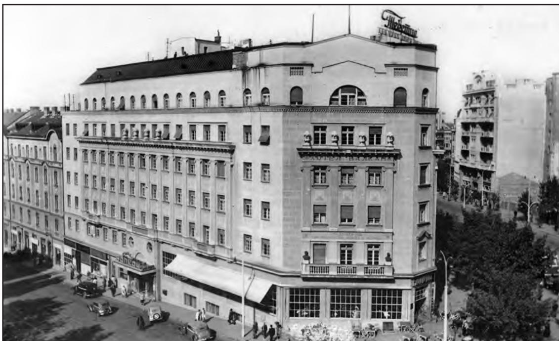
Сл. 8. Зграда хотела Балкан у Београду. Разгледница, око 1950.

Figure 8. Hotel Balkan building in Belgrade. The postcard, c. 1950.