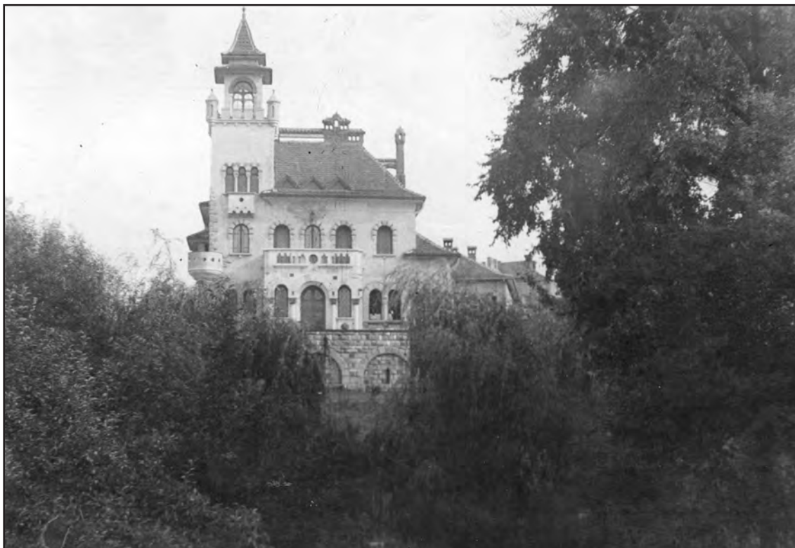
Сл. 5. Вила Карацић у Буковичкој бањи. Figure 5. Villa Karadžić in Bukovička Banja. Fig. 5. Villa Karadžić à Bukovička banja.

четвороспратнице. Акцент у композицији целине представља централна зона, по вертикали, коју чине профилисани елементи повезани полустубом, и три кружна отвора у поткровљу. Упркос наглашеној симетрији у основној концепцији здања и других реминисценција на историјске стилове, објекат у целини носи модерничко обележје.