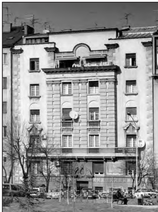
Сл. 7. Зграда Стевана Костића у Његошевој улици бр. 17 у Београду. 2003.

Figure 7. The building of Stevan Kostić in Njegoševa Street n° 17 in Belgrade. 2003.