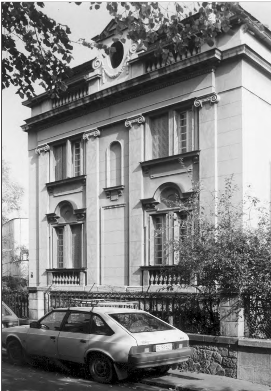
Сл. 2. Вила у улици Војводе Драгомира у Београду. Аутор фотографије: Милош Јуришић, 1998. Figure 2. Villa in Vojvode Dragomira Street in Belgrade. Author of the photograph: Miloš Jurišić, 1998. Fig. 2. Villa dans la rue Vojvode Dragomira à Belgrade. Auteur de la photo : Miloš Jurišić, 1998.