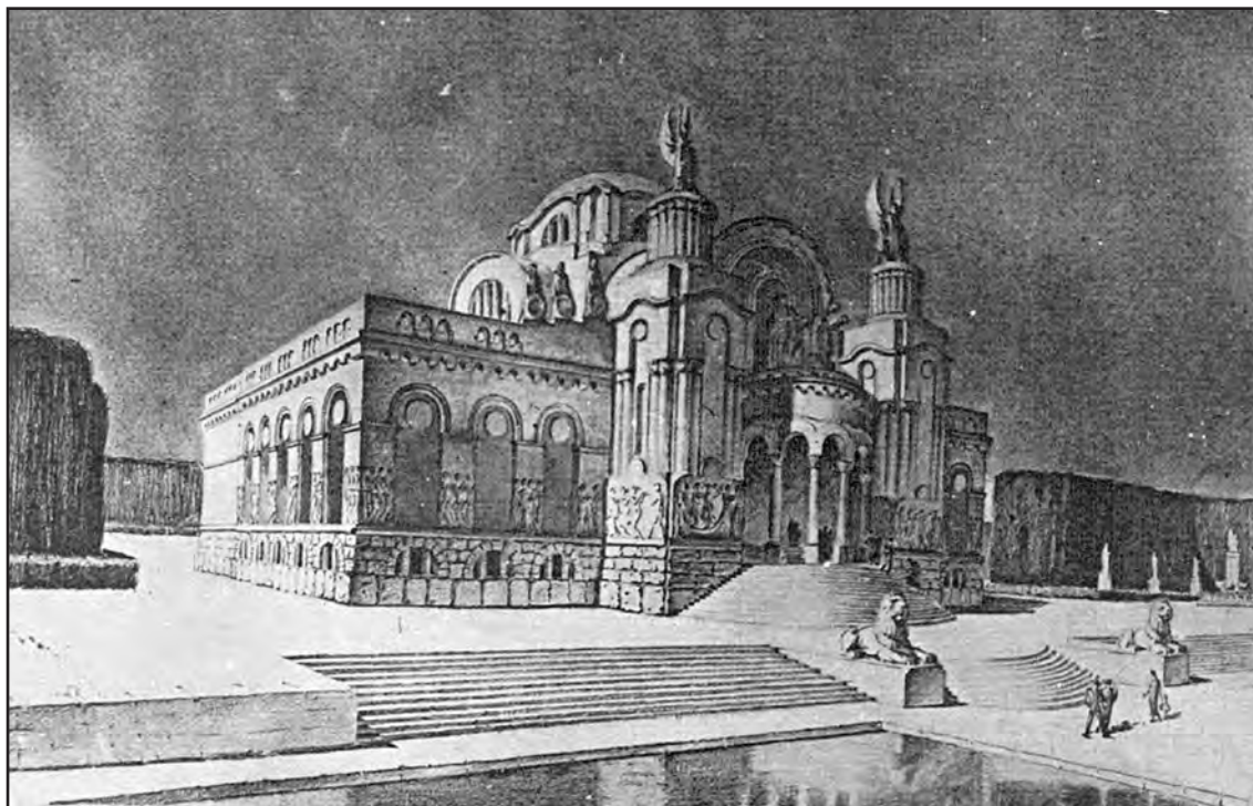
Сл. 1. Пројекат за изложбени павиљон. Figure 1. Project for the exhibition pavilion. Fig. 1. Projet pour le pavillon d'exposition.

на Малом Калемегдану, 1928. године, који је добио трећу награду. Овога пута, међутим, удео Папкова је остао нејасан.