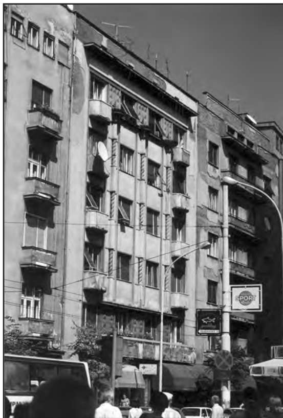
Сл. 6. Зграда Лазара Петровића у Македонској улици бр. 15 у Београду. Аутор фотографије: Милош Јуришић, 1998.

Figure 6. The building of Lazar Petrović in Makedonska Street n° 15 in Belgrade. Author of the photograph: Miloš Jurišić, 1998.