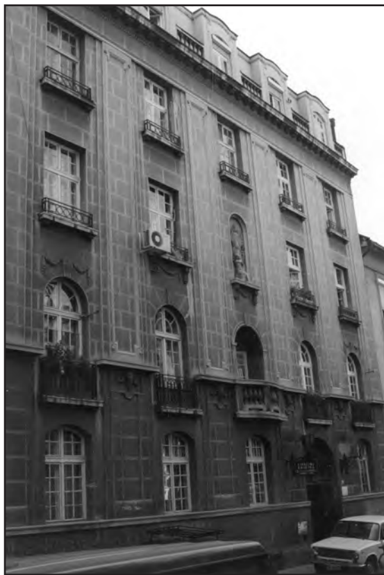
Сл. 4. Зграда Милутина Месаровића у Крунској улици бр. 22, у Београду. Аутор фотографије: Милош Јуришић, 1998.

Figure 4. The building of Milutin Mesarović in Krunska Street n° 22 in Belgrade. Author of the photograph: Miloš Jurišić, 1998.