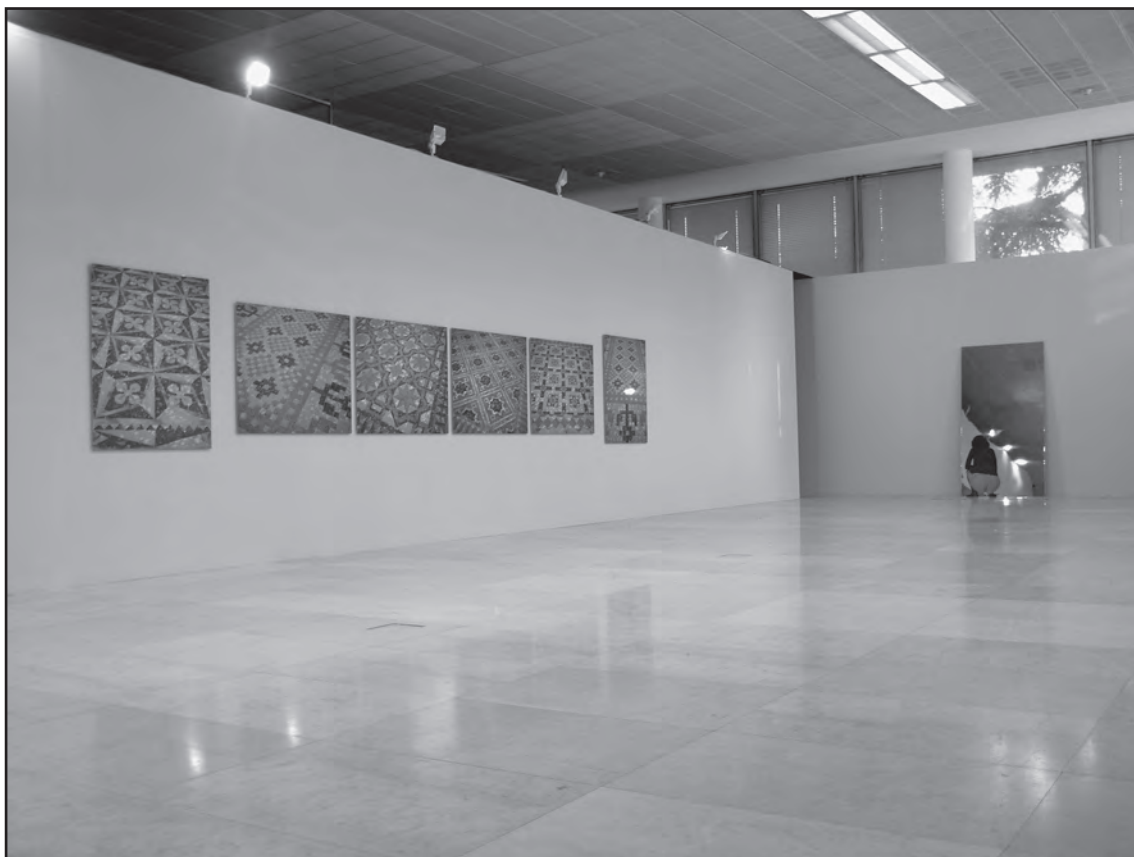
Сл. 1 Вим Делвоа – Мермерни подови и Микеланђело Пистолето – Жена која чучи Fig 1 Wim Delvoe – Marble Floors and Michelangelo Pistoletto – A crouching woman

овој прилици није реч о суочавању, већ о заједничком представљању, које је нашој средини било изузетно потребно. Ревизијски карактер ликовне манифестације је трансформисан у објективно сагледавање, тумачење и представљање актуелних уметничких токова унутар и ван граница СЦГ. Тема континенталног доручка је повезала уметнике са различитих полова, сугеришући трајну и бесконачно идиличну идеју заједнице, групе, „породице“, као прималног крика у уопштавању, уобличавању, именовању заједничког циља – идентификовања порекла и његовог означавања. Било да је реч о храни (материјалној или духовној) или понашању (општем), питање генетске атрибуције или