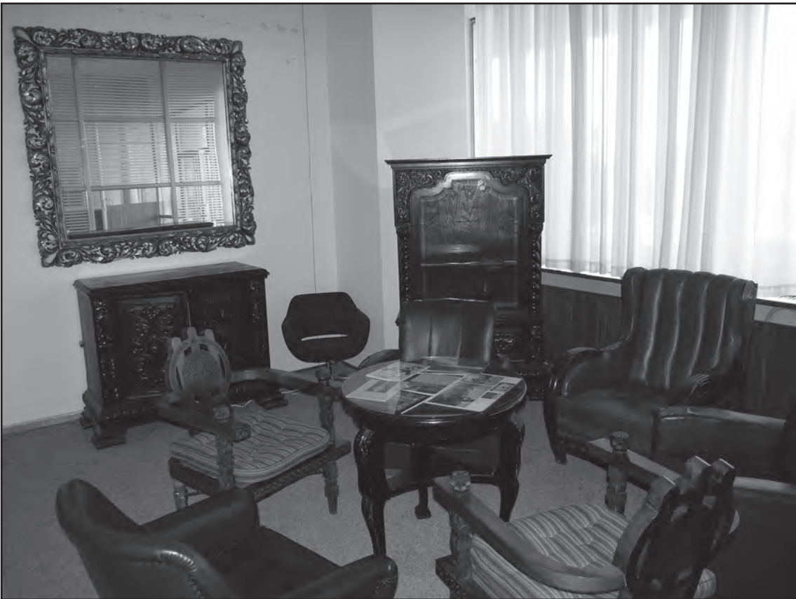
Сл. 2 Кристијан Болтански – Титови архиви Fig 2 Christian Boltanski – The Archives of Marshal Tito

али имајући у виду њен садржај и техничке потребе представљања, односно излагања. Ре-конструкција простора који су изабрани да представе радове шездесет уметника из Србије и Црне Горе и осталих делова читаве Европе подразумевала је студиозно испитивање и архитектонско осмишљавање презентације излагачког материјала. Музеј у музеју, градилиште снова (неопходан услов за презентацију савременог уметничког дела), лавиринтски организован простор показали су се као неопходни елементи у организовању изложбе. Адаптабилност одабраних простора оцењена је од стручне јавности као једина ваљана карактеристика 45. Октобарског салона. Одсуство критичког