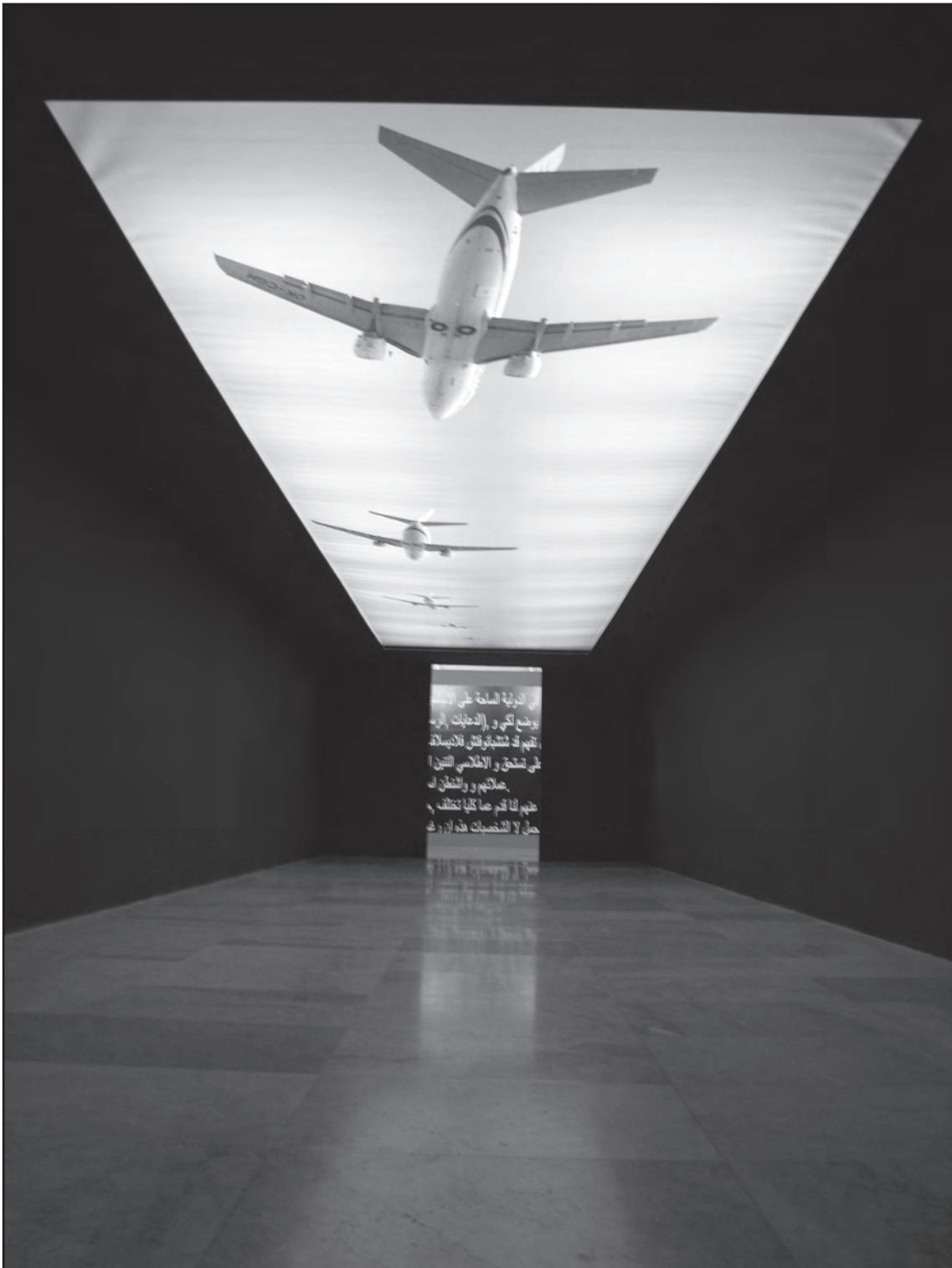
Сл. 4 Милена Гордић – Ваздушна линија Fig 4 Milena Gordić – As the Krow Flies