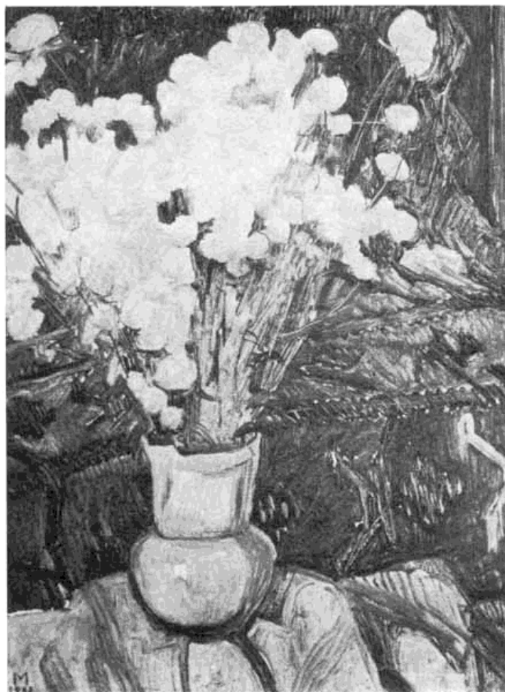
Сл. 3 — Милан Минић: Цвијеће (уље)

вајар Бока Јовановић. Отуда код њега један уздржани, али и префињени импресионизам, мирних и тихих боја. Иако се није бавио тако много сликарством као архитектуром, ипак има доста сликарских радова. У своме сликарству он је био непосредан. Прилазио је платнима са ведрином и хуманошћу, што су биле особине и црте његовог личног карактера. У животној борби, радећи плодно и стрпљиво на пољу архитектуре, мало му је преостајало времена да се још више ангажује у сликарству које је много волео. На неколико месеци пред смрт рекао ми је: „Да посвршавам неке хитне обавезе, па ћу се бацити само на сликарство“.