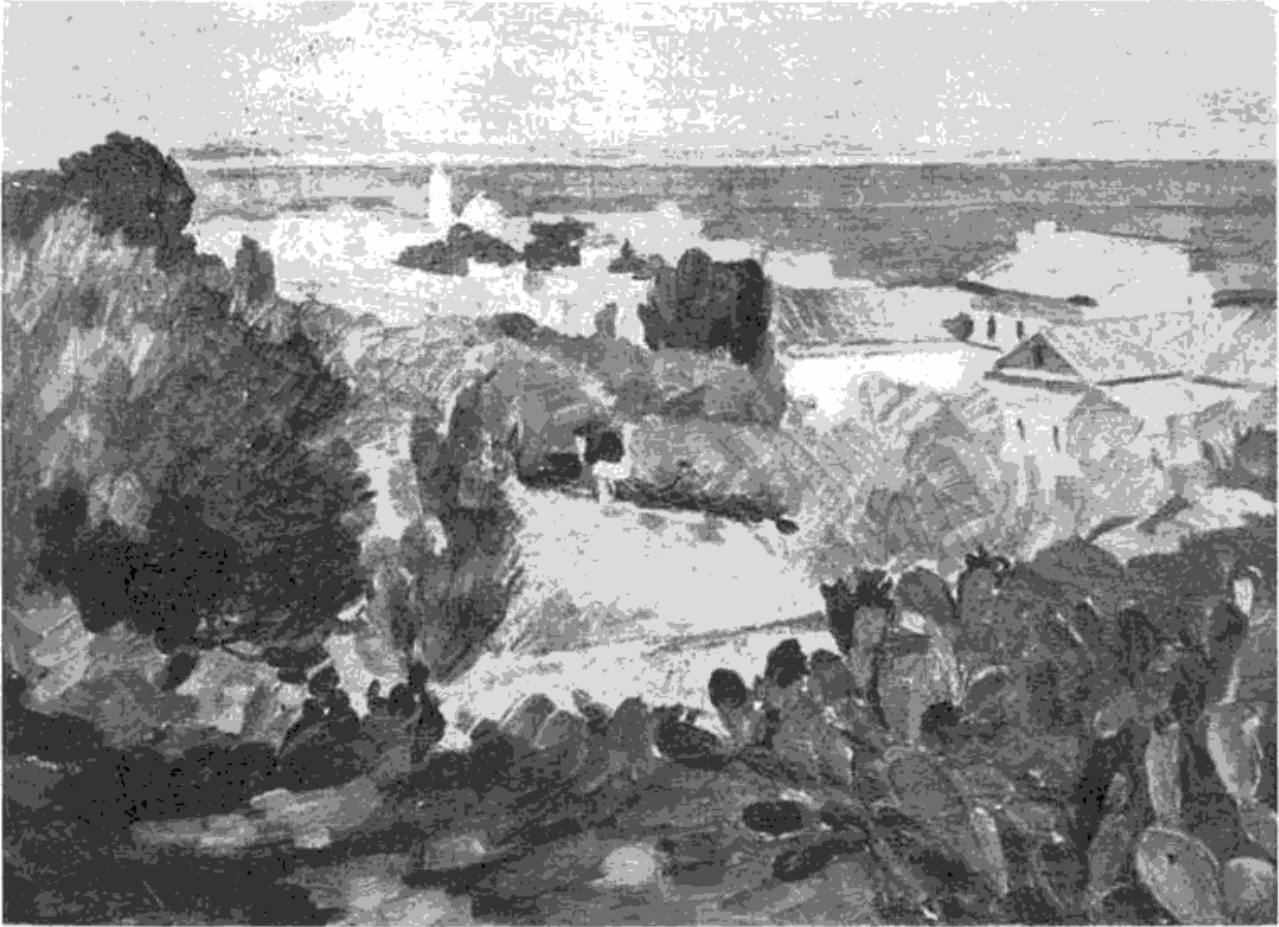
Сл. 1 — Милан Минић: Пејсаж са Корзике (уље, 1917)

Као архитекта Милан Минић је почео да иступа 1914. године, када је сарађивао на пројектовању зграде Српске академије наука у Београду. Пројектовао је неколико вила, хотела и других објеката.