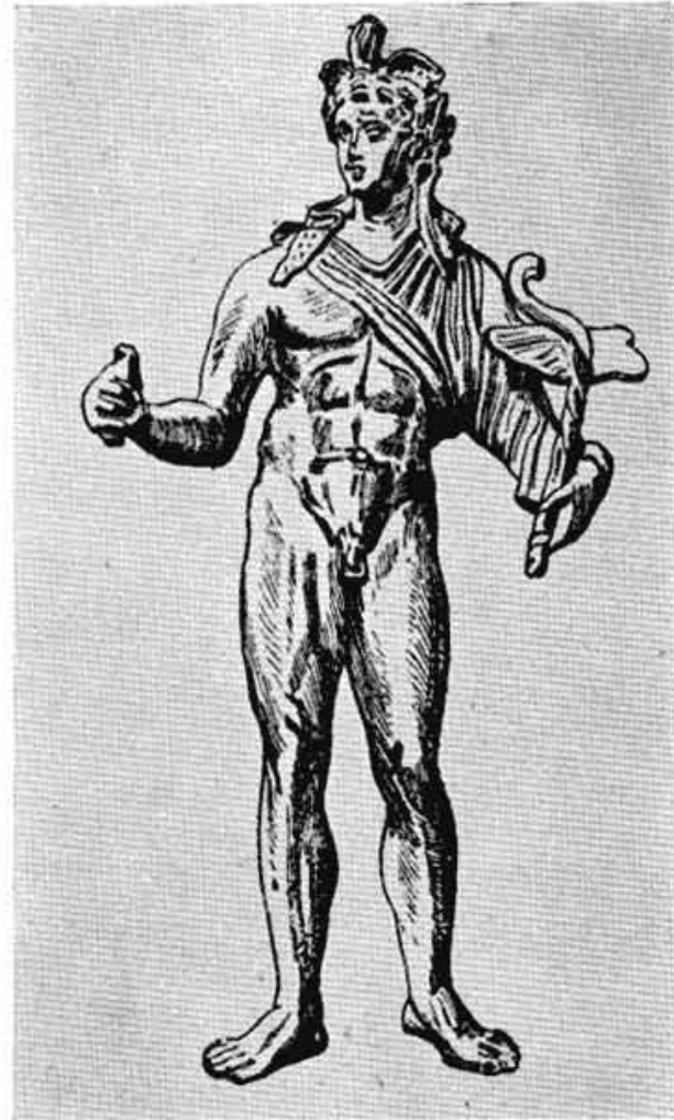
Сл. 5 — Статуета Хермеса у Лувру

дере. За Хермеса са Андроса је карактеристично и то, што у себи спаја старије и млађе елементе, што се нарочито огледа у обради главе: ту су елементи Праксителове уметности благо спојени са елементима Лисиповог правца. 14