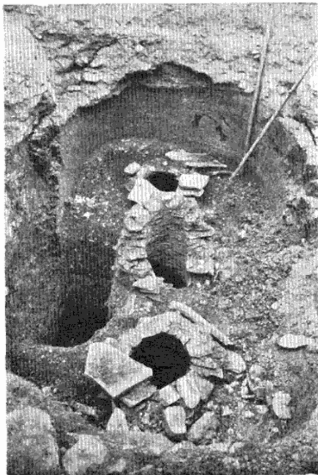
Сл. 3 — Остаци рударских пећи (?) у граду Жрнову на Авали. Уништени су заједно са градом 1934 године.

Архивско проучавање о томе шта је црвац показало је да је црвац цинабарит, 21 да се он јавља код доброг дела српских и босанских рудника сребра и олова, и да се његова појава везује за интензиван рад у рудницама од око 1420 године, када се појављују и такозвани млађи српски рудници. 22 На геолозима је данас да утврде у каквом се односу према олову и сребра јавља цинабарит у поменим рудницама.