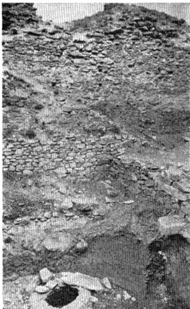
Сл. 2 — Остаци рударских пећи (?) у граду Жрнову на Авали. Уништени су заједно са градом 1934 године.

Међу Дубровчанима чија су имена у вези с парницама у Рудиштима сигурно их је било који ту нису стално становали, него се бележе као чланови суд-