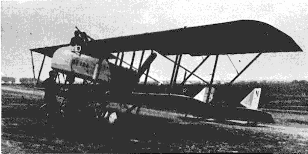
Сл. 3 — Авион у Београду из Првог светског рата

близине. Не само то, него су и помогли тешкој артиљерији да брзо регулише ватру. Непријатељска артиљерија прецизно је тукла браниочеве положаје, све прилазе и сигурно крчила пут својој пешадији бришући својом ватром све отпоре.