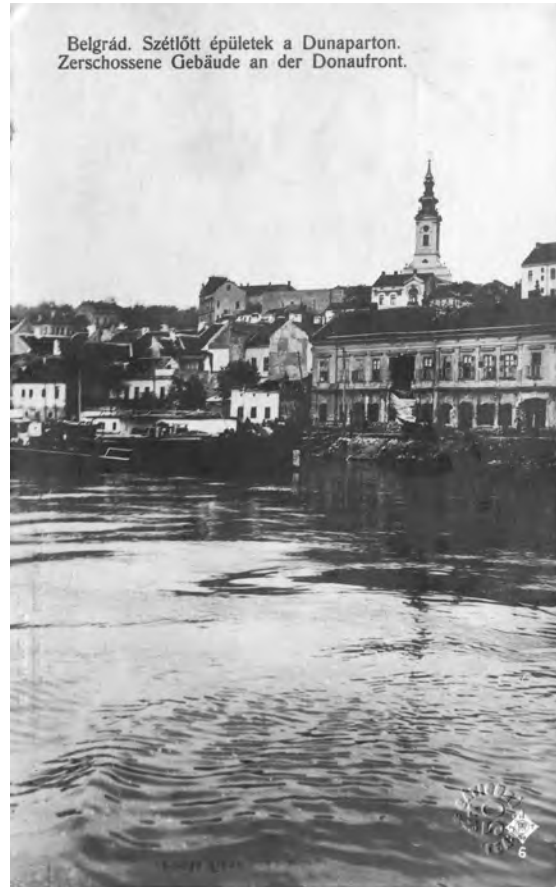
Слика 2. Панорама Београда крајем XIX века (Музеј града Београда, Ур 15295) Figure 2 Panorama of Belgrade in the end of 19 th century (Belgrade City Museum Ур 15295)

„Песничка кућа Илић била је осамдесетих година једини књижевни клуб у престоници. Сви покушаји, и ранији и познији, да се оснује какво књижевном друштво [...] нису ни близу добаци-