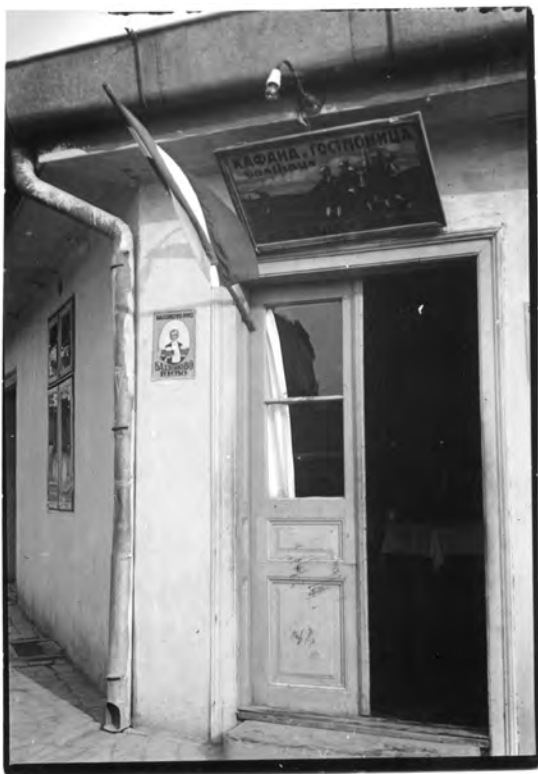
Слика 3. Кафана Седм Шваба , почетком XX века