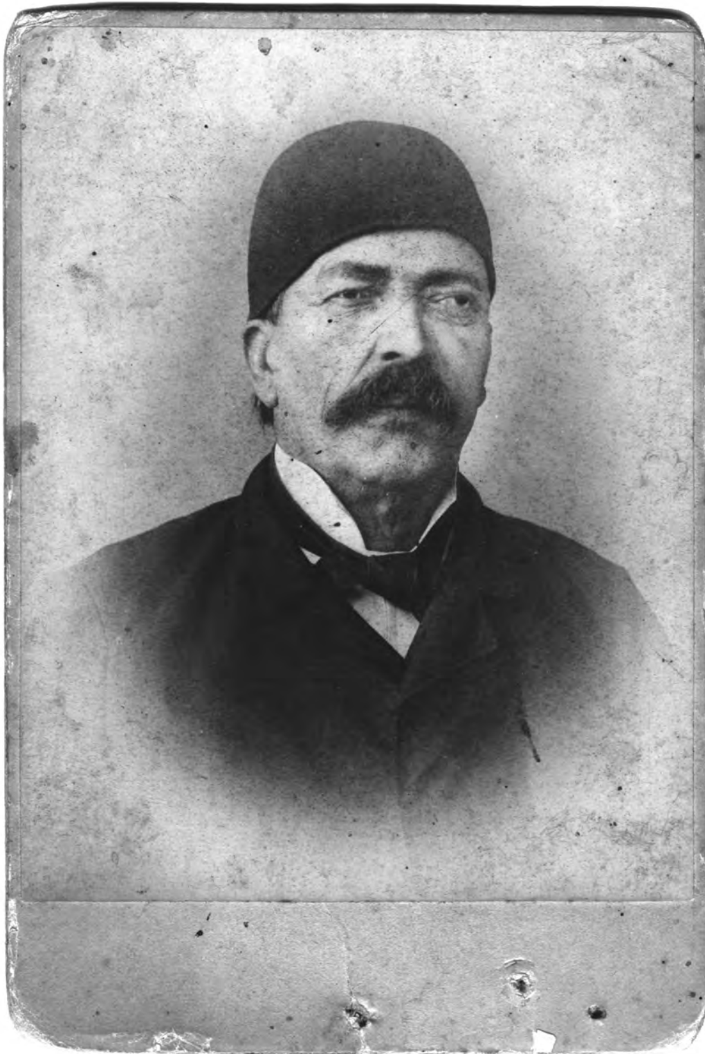
Слика 1. Портрет Јована Илића, крај XIX века (Музеј града Београда, КИ-I 1190) Figure 1 Portrait of Jovan Ilić, end of 19 th century (Belgrade City Museum, КИ-I 1190)