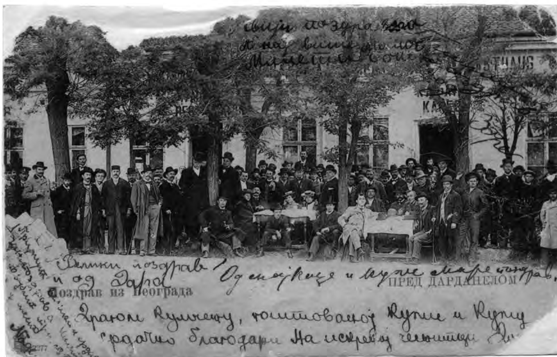
Слика 7. Кафана Дарданели у Београду, код Кнежевог споменика, уочи рушења 1901. Figure 7 Restaurant Дарданели in Belgrade near the Prince Mihailo's monument, before demolition in 1901

Нико од њих није био високи чиновник државни, велики представник чаршије. Били су то већином људи „понесени па пуштени“, људи који су догурали до пола пута па их мрзело да се даље море, те угазили зарана у живот ... Све су то иначе људи добра срца, дружељубиви, увек спремни за шалу и непоправими љубитељи уметности и уметника... Они су се са свима познавали, сваком прилазили, уз сваки сто седали и на све пристајали.“ 13