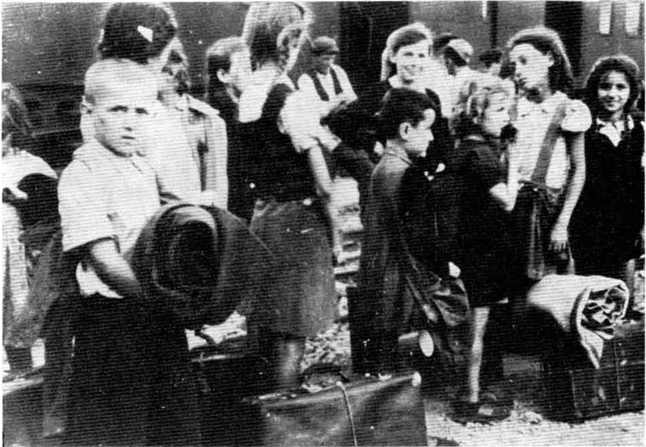
Повратак деце у ослобођени Београд Le retour des enfants a Belgrade délibéré

Приликом одређивања дужности међу члановима Извршног одбора, мени је одређено да се старам о снабдевању грађанства