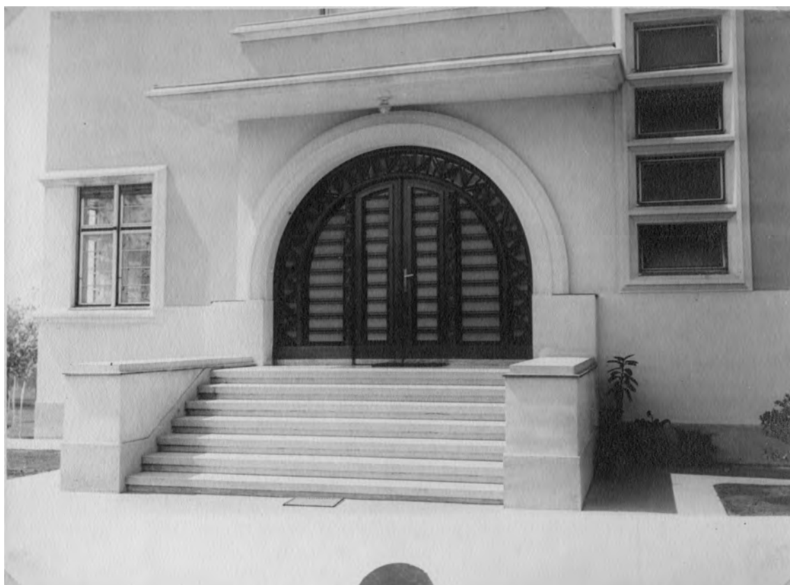
Слика 7. Улаз у вилу Душана Томића Figure 7 Entrance to Dušan Tomić's villa

талне бордуре били су додатно потенцирани светлијим тоном у односу на основну боју подлоге.