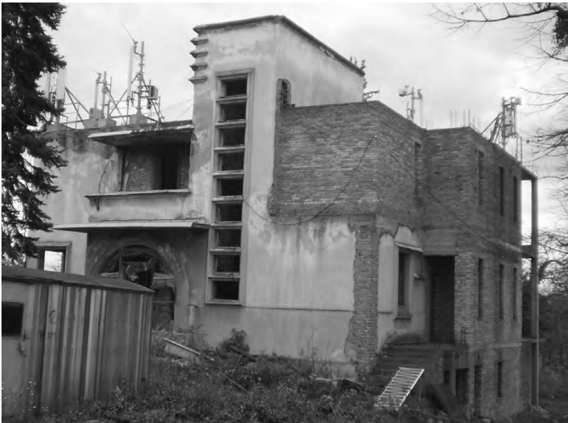
Слика 9. Вила Душана Томића, садашње стање Figure 9 Dušan Tomić's villa