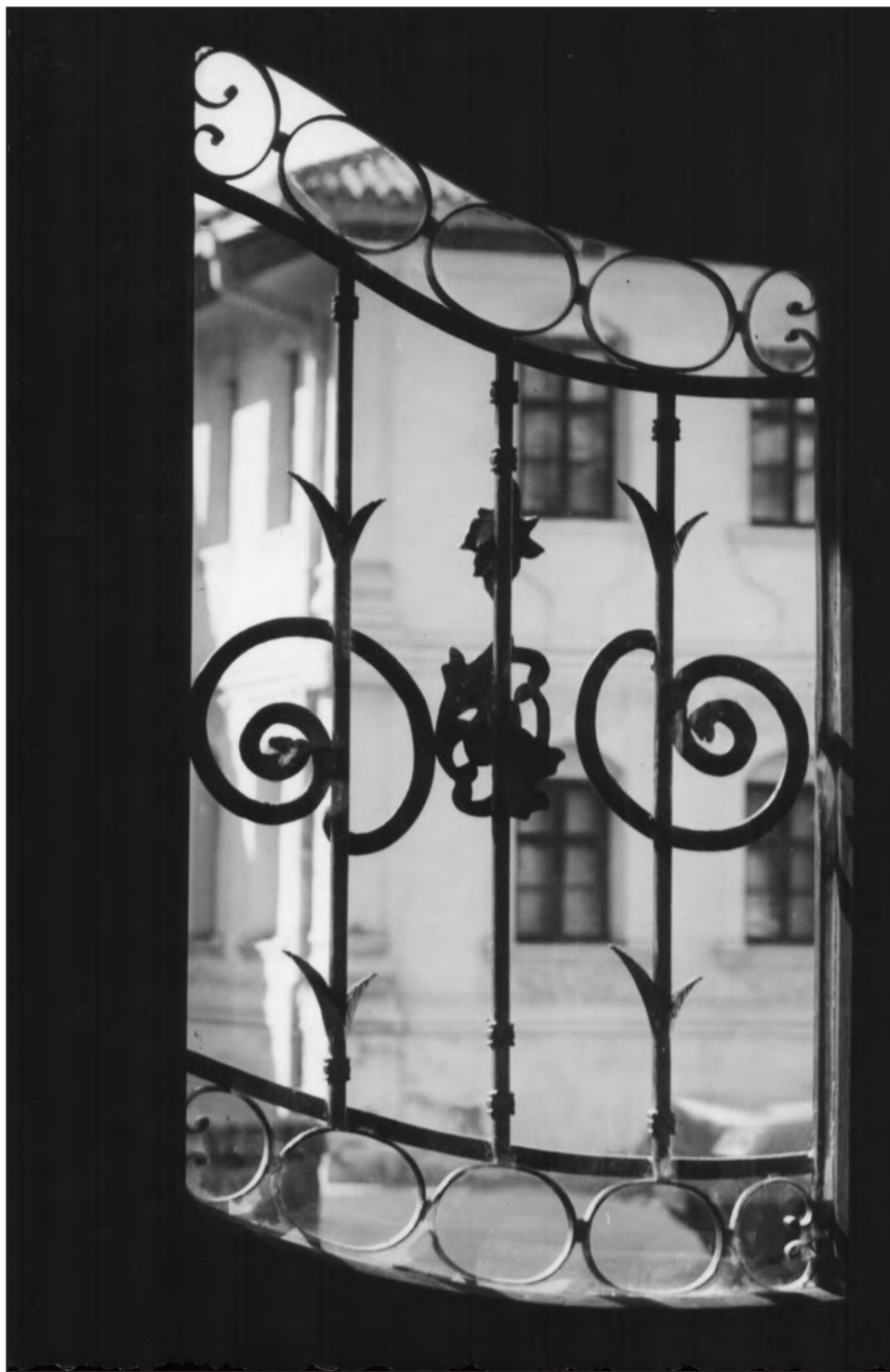
Сл. 1. Поглед на Конак кнегиње Љубице из зграде у улици Кнеза Симе Марковића 9, 1999. Figure 1. The Residence of Princess Ljubica, seen from the building on the 9 Sime Markovića Street, 1999.