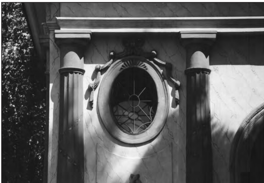
Сл. 5. Уметнички павиљон „Цвијета Зузорић“, 1999.