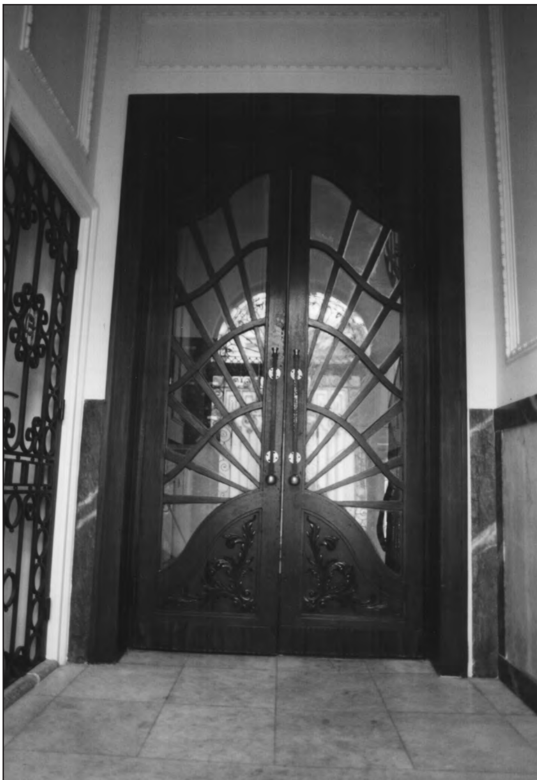
Сл. 10. Хиландарска улица 16, 2004. Figure 10. 16 Hilandarska Street, 2004. Fig. 10. 16, rue Hilandarska, 2004.