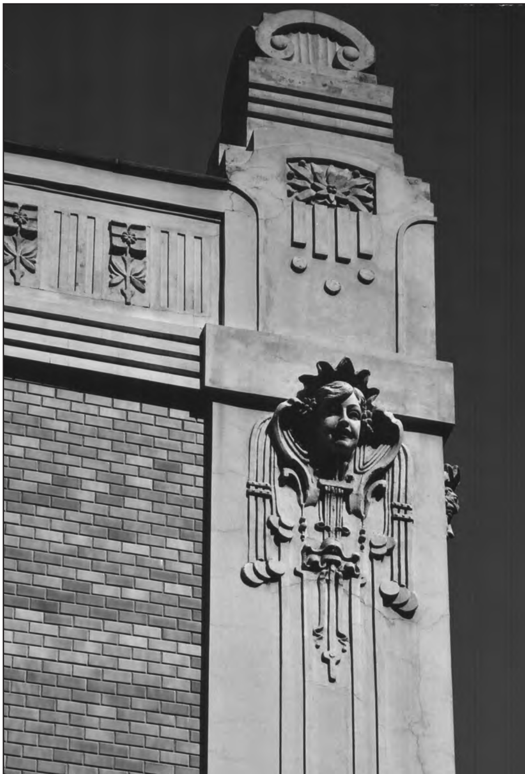
Сл. 7. Угао улица Кнез Михаилове и Краља Петра, 2000. Figure 7. Corner of Knez Mihailova Street and Kralja Petra Street, 2000. Fig. 7. Le coin des rues Knez Mihailova et Kralja Petra, 2000.