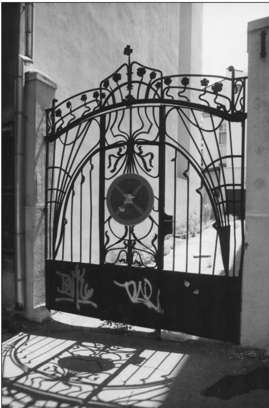
Сл. 8. Доситејева улица 26, 2002. Figure 8. 26 Dositejeva Street, 2002. Fig. 8. 26, rue Dositejeva, 2002.