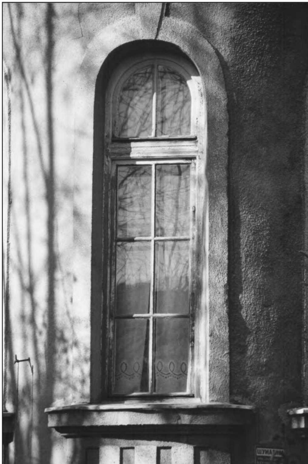
Сл. 4. Улица Војводе Драгомира 12, 2002. Figure 4. 12 Vojvode Dragomira Street, 2002. Fig. 4. 12, rue Vojvode Dragomira, 2002.