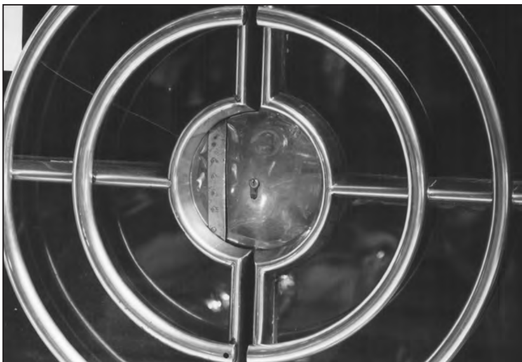
Сл. 6. Његошева улица 65, 2002.