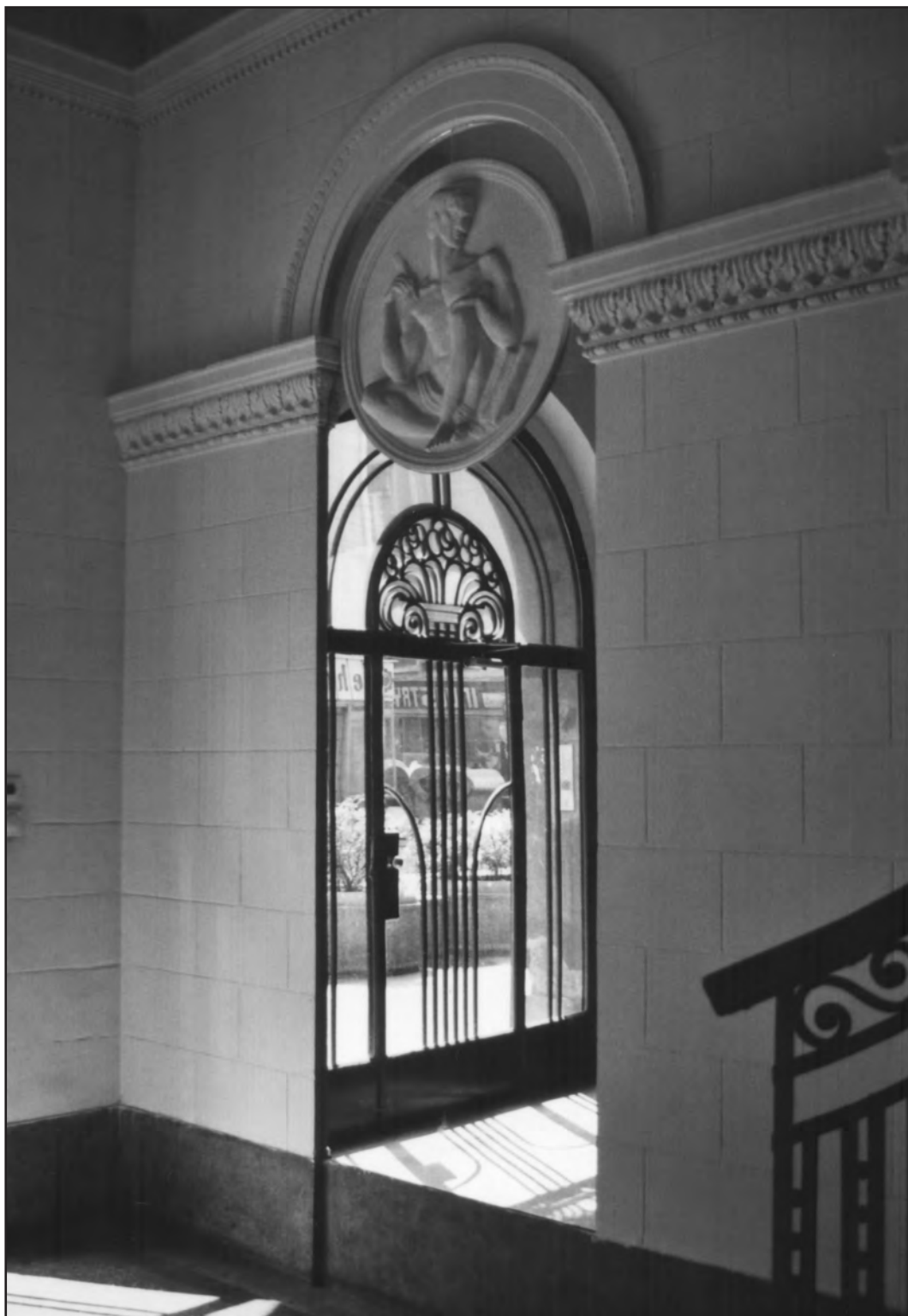
Сл. 3. Васина улица 14, 2000. Figure 3. 14 Vasina Street, 2000. Fig. 3. 14, rue Vasina, 2000.