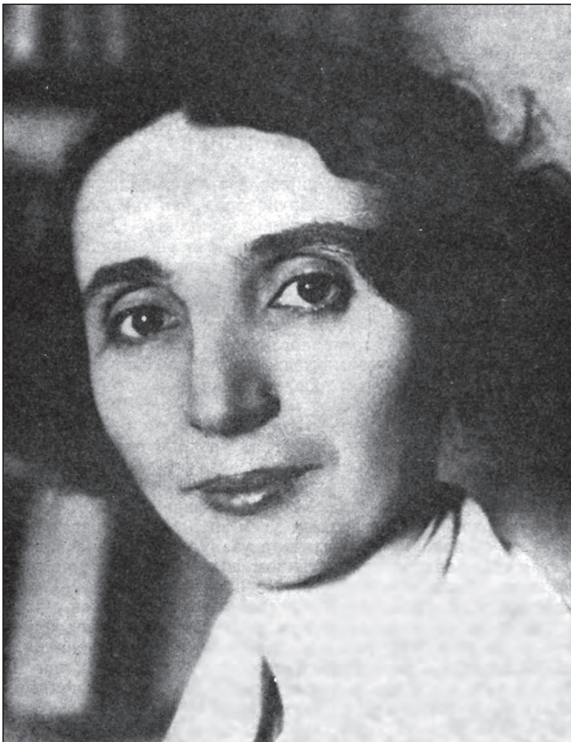
Сл. 1. Ксенија Атанасијевић Fig. 1 Ksenija Atanasijević