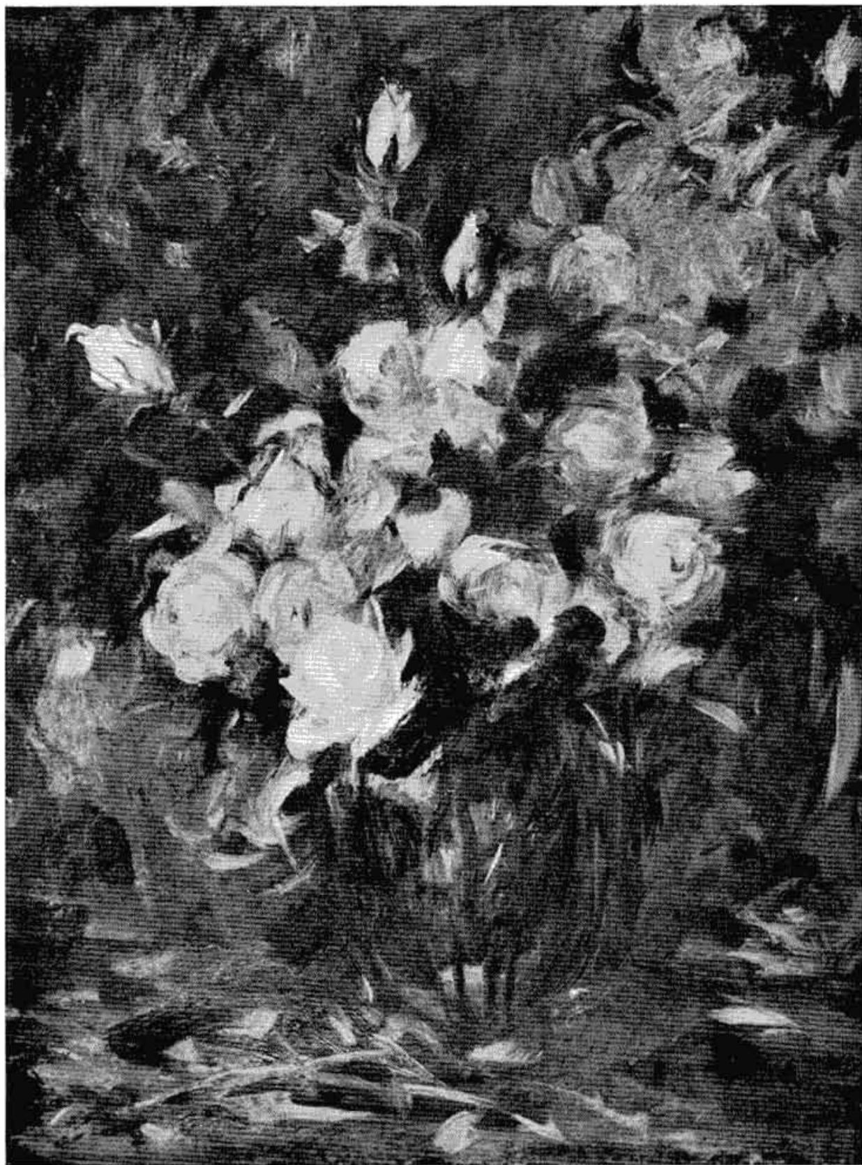
Сл. 2 — Руже, последњи рад Паје Јовановића. — Музеј града Београда