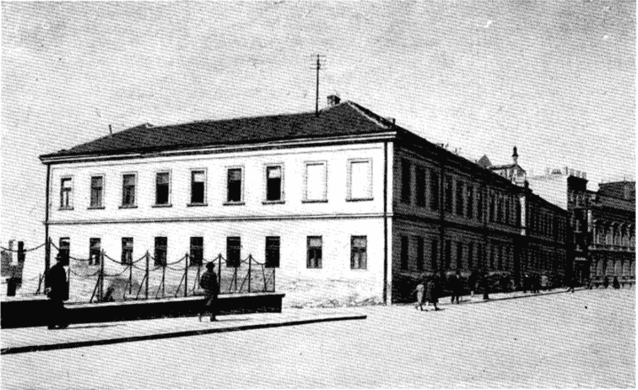
Сл. 2 — Митрополија 1933 године.

њеним темељима око подизања нове зграде, данашње Патријаршије, која је била готова 1935 године 16 , и која се налази на углу ул. 7 јула и ул. Кнеза Симе Марковића, преко пута Саборне цркве.