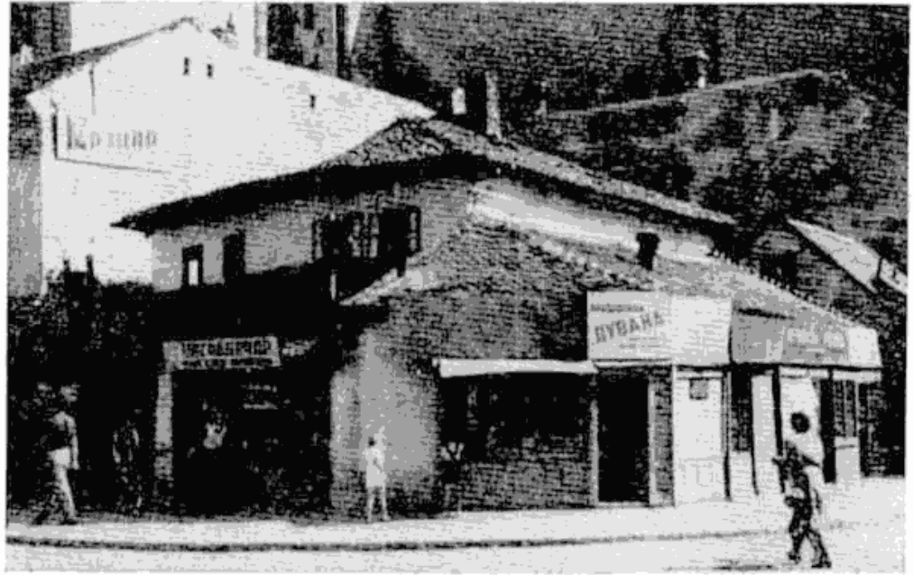
Сл. 1 — Стара кућа у Нушићевој улици

чин живота и културне потребе били довољно развијени да би они могли да продуже и развијање ранијег архитектонског стварања. Тако су настале и карактеристичне особине ове куће, различите од првих стилски уобличених и обликовно развијених београдских кућа истог доба, као што је била на пример Ичкова кућа.