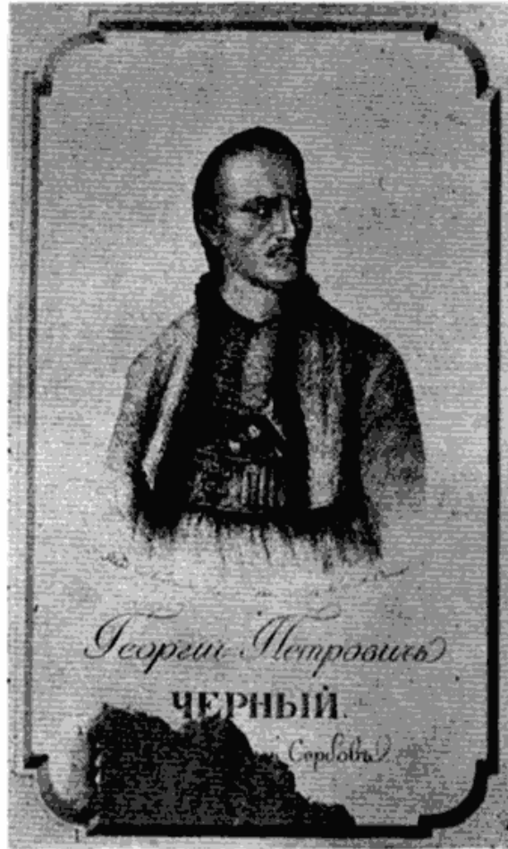
Сл. 1 — Карађорђе, рад француског сликара и гравера Робера, из 1808 г. у Београду, објављен у Москви 1810 г.

По наредби Српског ученог друштва, израђени су 1865 год. план и нацрт, а идуће године је и фотографисана „кућа на великој пијаци, у којој је негда