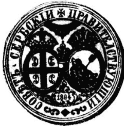
Сл. 4 — Печат Правителствујућег Совјета Србског

бро познате литературе коју су обрадили писци онога времена и доцнији стручњаци Устаничког доба. И поред тога сматрали смо за потребно да са своје тачке гледишта осветлимо материјал који нам може нешто рећи и пружити јаснију слику зграда у којима је заседавао Совјет, као и прилика које су у њима владале јер, данас, 150 година после Првог српског устанка, не постоји ни Текија, нити друга која зграда у којој се Совјет бавио у Београду. Нису остале ни зграде у Смедереву и Борку. Сачувана су једино два манастирска конака — један у Вољавчи и