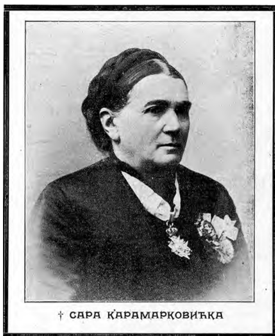
Слика 1. Сара Карамарковић, Домаћица 1910. године (Народна библиотека Србије) Fig. 1 Sara Karamarković, Domaćica [Housekeeper], 1910 (National Library of Serbia)

оваква идеја већ постојала, али је због материјалних разлога њено остварење морало да сачека бољи тренутак, обећао је сталну месечну потпору за ту установу, у износу од 150 динара.