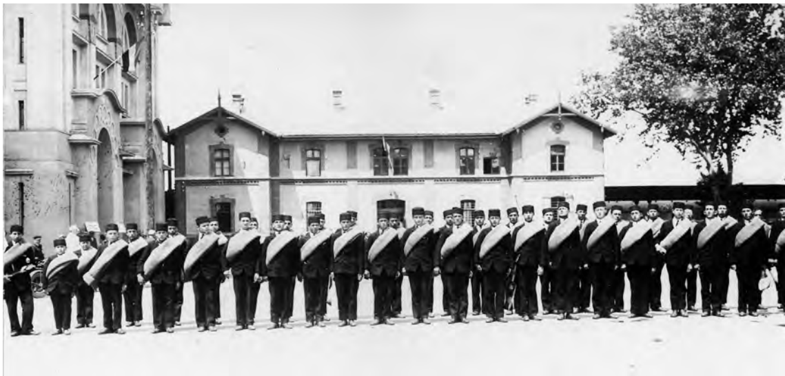
Слика 4. Учесници Свесоколског слета у Београду, 1930. Снимак је начињен на Железничкој станици