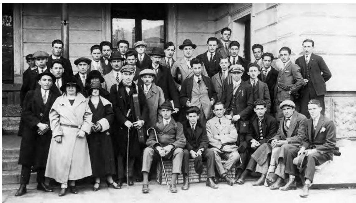
Слика 3. Ученици Трговачке академије из Сомбора, на екскурзији у Београду 1924. године