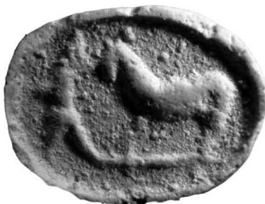
Слика 2а. Figure 2а

кована у хеленистичкој и каснијој глиптици. Такав тип се атрибуира Лисиповој школи, иако неки аутори (Липолд) сматрају да има каснохеленистички узор. 8