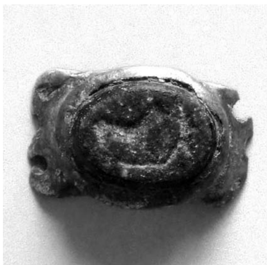
Слика 2. Figure 2