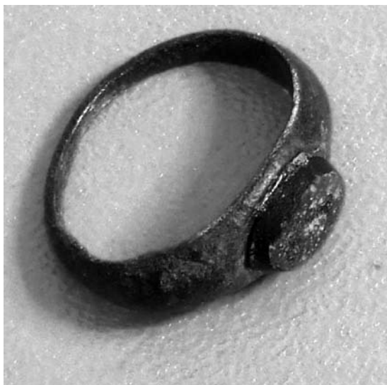
Слика 1. Figure 1