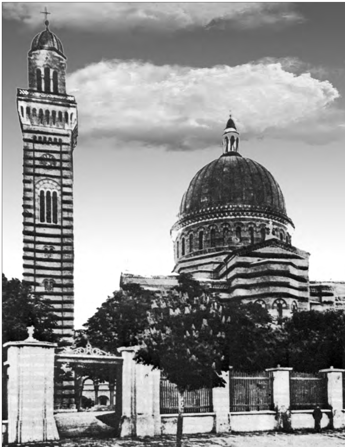
Слика 4. Преображенска црква у Панчеву Figure 4 Church of Transfiguration in Pančevo