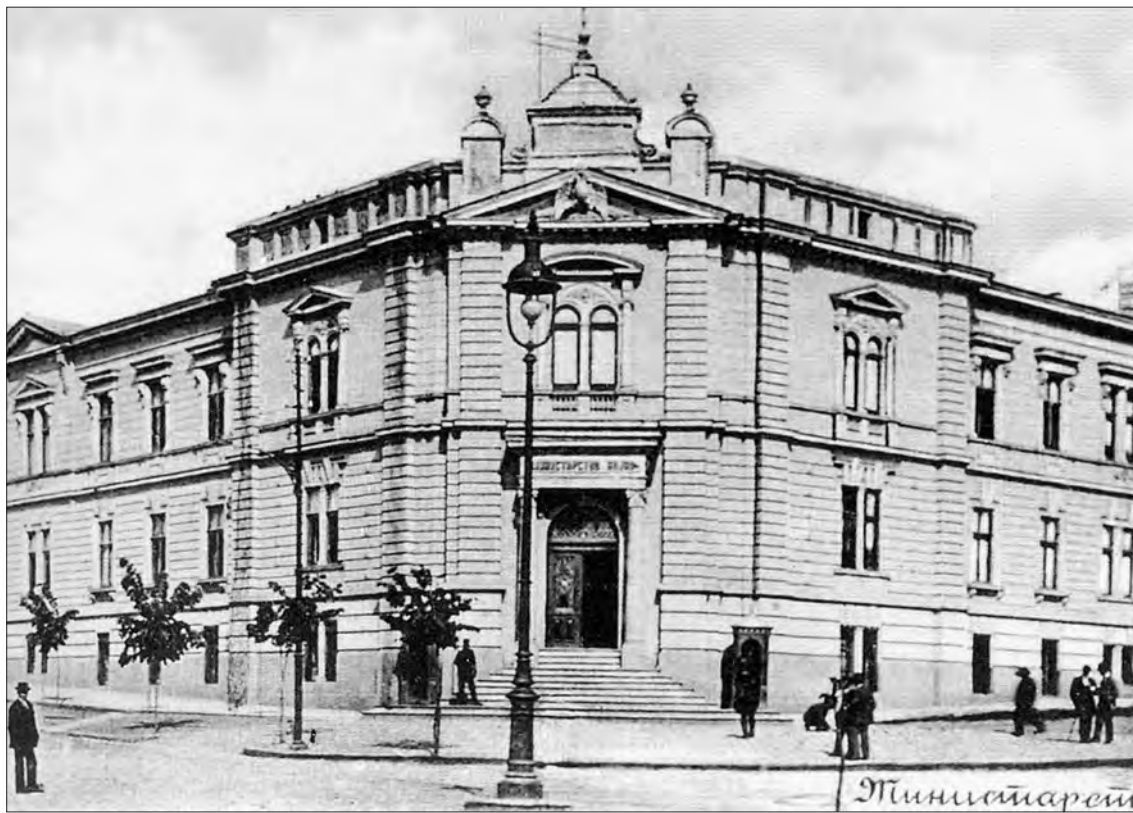
Слика 5. Палата Министарства војног, архитекте Ј. Илкића Figure 5 Building of the Ministry of Defense, architect J. Ilkić

минисценцијама на палате италијанске ренесансе, у духу савремене бечке академске методологије, истакнути су богато украшени прозори. 22 Иако су фасадне зоне хијерархијски раздвојене по висини, њихова рашчлањеност по ширини их чини изузетно компактним. На фасади нема ризалита који би стварали вертикалну опозицију мирним, водоравно регулисаним пуним и празним површинама. Ни предодређени главни мотив pročеља – средишњи двојни прозор, уоквирен едикулом коју носе јонски пиластри, не уноси вертикализам у слику