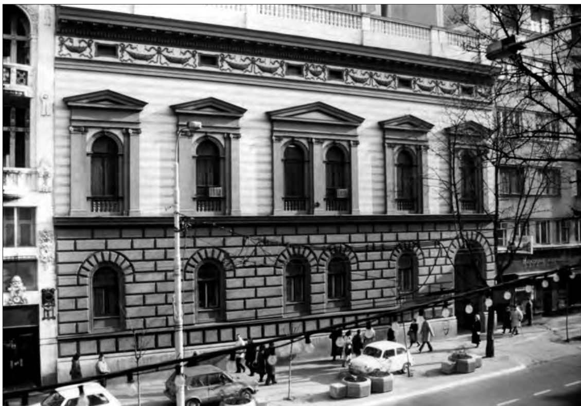
Слика 6. Фасада палате Министарства правде Figure 6 Façade of the Ministry of Justice

шен је двојним прозором под заједничким тимпаноном и ефектном оплатом од црвених и жућкастих керамичких плочица. Композицију средње зоне, завршену ненаметљивим, плошно обрађеним венцем од блок-конзолица и фризом декоративних фестона између ефектно распоређених таванских прозорчића, заокружује атика са стилизованом балустрадом. Петоделност атике понавља петоделну поделу средњег и приземног корпуса, одређену прозорским осовинама. Чињеница да се она простире изнад читаве фасаде говори о одлучности