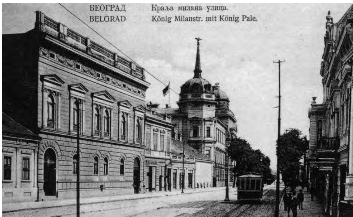
Слика 1. Палата Министарства правде и Управе квартa Теразијског (разгледница) Figure 1. Building of the Ministry of Justice and Headquarters of the Terazije Precinct (picture postcard)

грађевина, заживела је пракса да се пројектантима у државној служби додељују задаци које би решавали у тандему. 11 Углавном се радило о провереним и свестраним стручњацима, чије су компетенције верификоване иностраним дипломама и успешним реализацијама. Због обимног посла и кратких рокова, архитекти Одељења су често прибегавали типским решењима у пројектовању одређених врста зграда, при чему су личне концепције потискивали у други план. 12