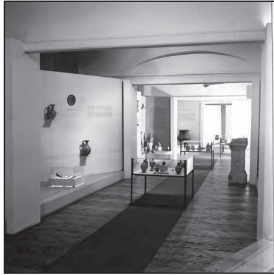
Сл. 1. Последња изложба која је организована у музејском простору у Змај Јовиној 1/1, Старе културе и народи на тлу Београда , од 30. јуна 1963. до 1. марта 1964.

У наредном времену, Музеј је имао великих потешкоћа да нађе одговарајући простор за своје повремене тематске изложбе, а посебно да задржи ауторски идентитет манифестација које је организовао у различитим ентеријерима. Излагало се у Дому омладине, Дому ЈНА, радничким универзитетима, или се гостовало у просторима других музеја. Музеј града Београда (некада Општински, потом Градски музеј) никада није поседовао зграду са којом би био идентификован, по којој би био препознатљив широј јавности. Без обзира на бројне успешне акције које је спровео, остајао је у сенци. Организовањем повремених