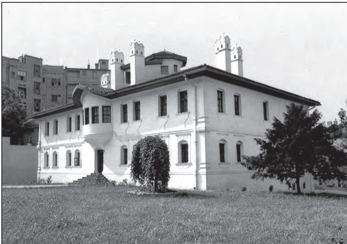
Сл. 2. Конак кнегиње Љубице, један од малобројних објеката у којима Музеј града Београда има организовану сталну музеолошку поставку

Figs 2 The Residence of Princess Ljubica, one of many buildings under the Museum's care housing permanent displays