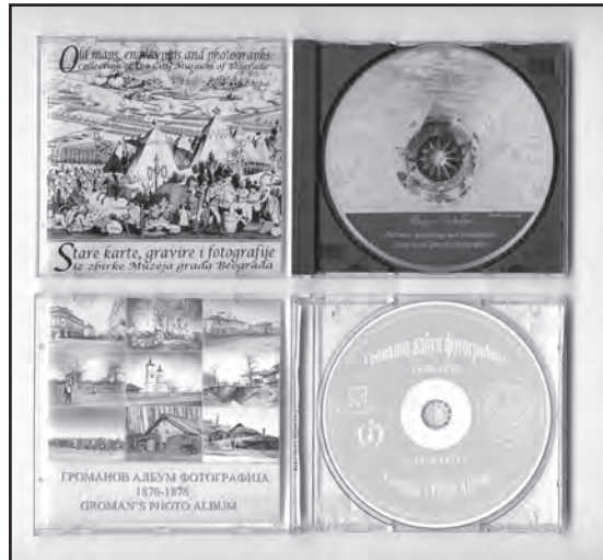
Сл. 4. Компакт дискови – нова врста медија на којима стручњаци из Музеја града Београда објављују резултате свога рада у сарадњи са другим институцијама

Fig. 4 Compact discs – a new medium used by the Belgrade City Museum staff to publish their results in concert with other institutions