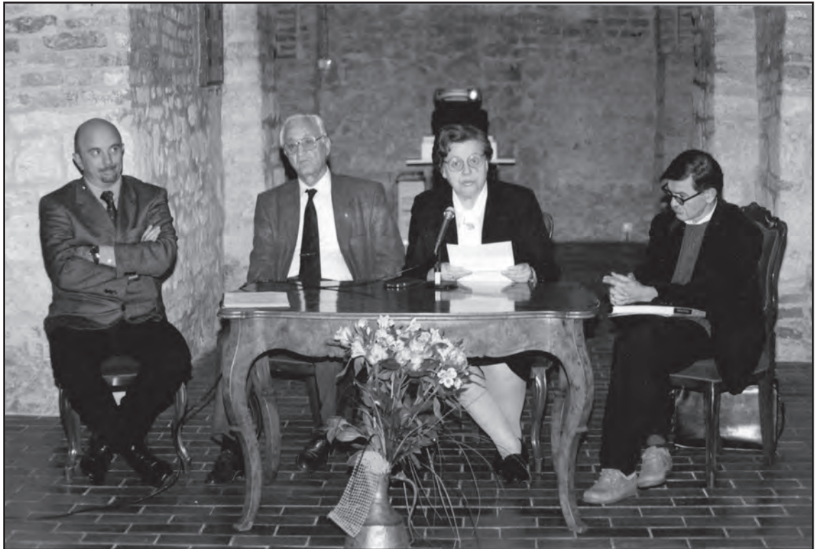
Сл. 6. Свечана промоција Монографије Музеја града Београда 15. октобра 2003. године у Сали под сводовима Конака кнегиње Љубице