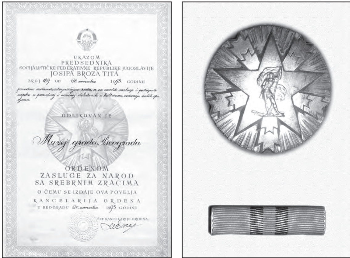
Сл. 5. Председник СФРЈ Јосип Броз Тито одликовао је Музеј града Београда Орденом заслуге за народ са сребрним зрацима 20. новембра 1973. године Figs 5 The Belgrade City Museum was awarded the Silver Rays Medal of Merit by SFRY President Josip Broz Tito on November 20, 1973

школа, као и студенти Београдског универзитета. За успех такмичења, била је неопходна сарадња професора у школама, чија дужност је била да направе селекцију и препоруче радове за конкурс. Овако замишљен маркетиншки уплив Музеја међу Београђане имао је за циљ да побуди интерес најмлађе публике за историју и културу града у којем живе. Интересовање је било изузетно велико, па је рок за предају радова продужен. 30 Од 1.500 радова, на