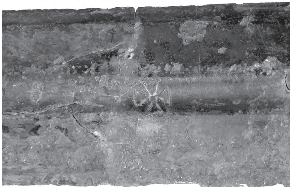
Сл. 2: Средњовековни мач из Земуна Fig. 2 Medieval sword from Zemun

Београду. 6 Овај мач, идентификован као производ италијанских радионица, датован је у крај XII или почетак XIV века. 7 Накрснице квадратног пресека са зарубљеним угловима, које се налазе на мачевима из Земуна и Војног музеја, нису познате на предметима ове врсте у Србији. 8