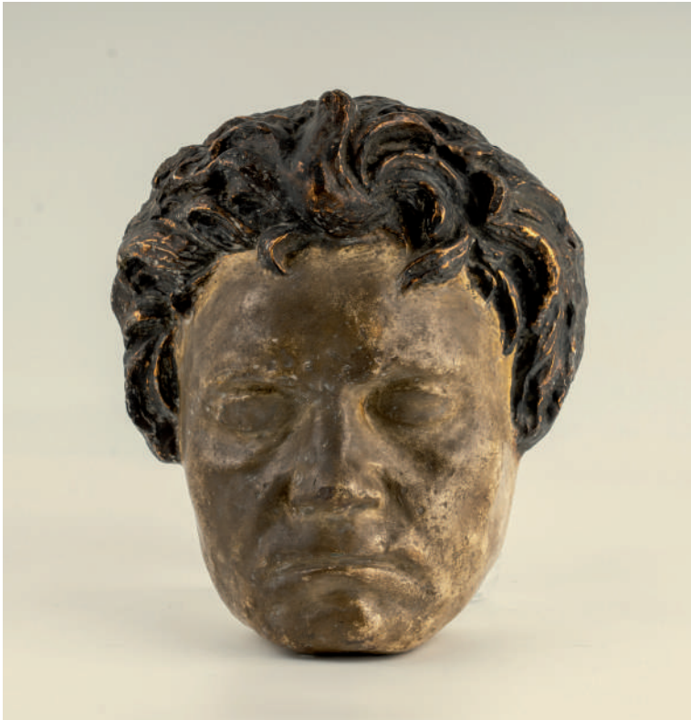
Слика 13. Посмртна маска, гипс, инв. ЛБВ 305