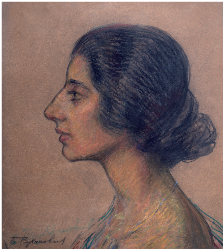
Figure 5 Beta Vukanović, Jewish Girl (Paula Duhfeld) , circa 1925, pastel, 34.5 x 38.5 cm, inv. LBV 55

„Јужну Србију неизмерно волим, и њене пејзаже, и њене типове, и њене костиме.“ 74 Јер, како је истакао Лазар Трифуновић, „том свету је Бета Вукановић одана, сликала га је с љубављу, без социјалног протеста и горчине, онако како га је доживела, са благошћу и идеализмом, с наивном вером у изворност и неоштећеност народног живота.“ 75