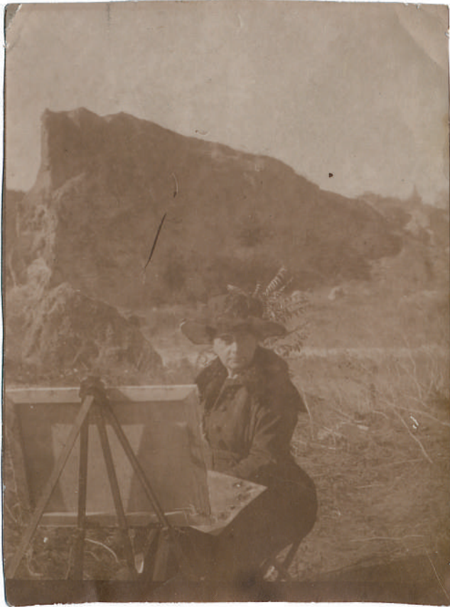
Слика 7. Бета Вукановић док слика у природи, до 1914, Музеј града Београда

Figure 7 Beta Vukanović while painting in nature, by 1914, Belgrade City Museum