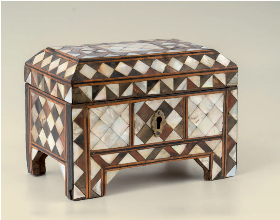
Слика 3. Кутија, дрво и седеф, 18 x 14,5 cm, инв. ЛБВ 300