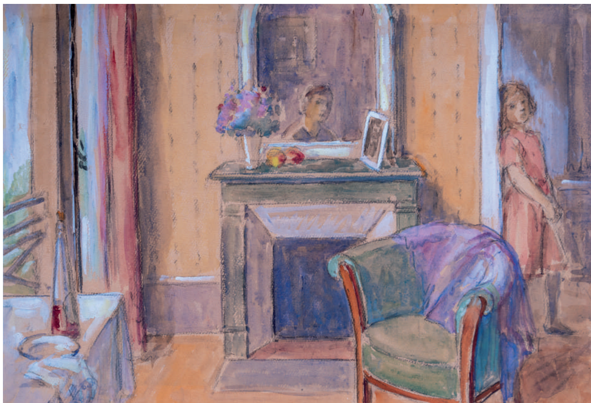
Слика 14. Бета Вукановић, Моја соба у Паризу , 1914, акварел и гваш на папиру, 49,5 x 34 cm, инв. ЛБВ 69 Figure 14 Beta Vukanović, My Room in Paris , 1914, watercolour and gouache on paper, 49.5 x 34 cm, inv. LBV 69

На сведеном, интимистичком формату слике је уприличила типичан атељерски мотив, у складу са ликовном поетиком раномодернистичке слике. Модерност представљеног лежи у чињеници да сликарка није заоденула акт у митолошко-алегоријско рухо, за чиме су посезали сликари претходних стилских епоха, већ је тему сместила у ентеријер атељеа. Тиме је ликовним језиком уобличио студио као „симболичан топос уметности“, те насликала основне компоненте сликарског деловања: уметника, модела и платно, као простор њихове комуникације. 117