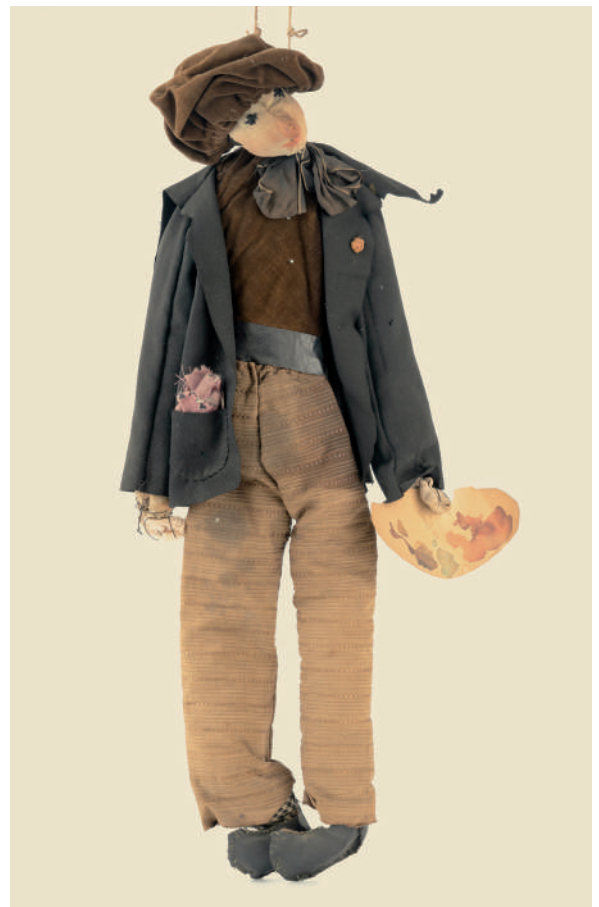
Figure 11 Milena Pavlović Barili, Painter , textile, height 58 cm, inv. LBV 254