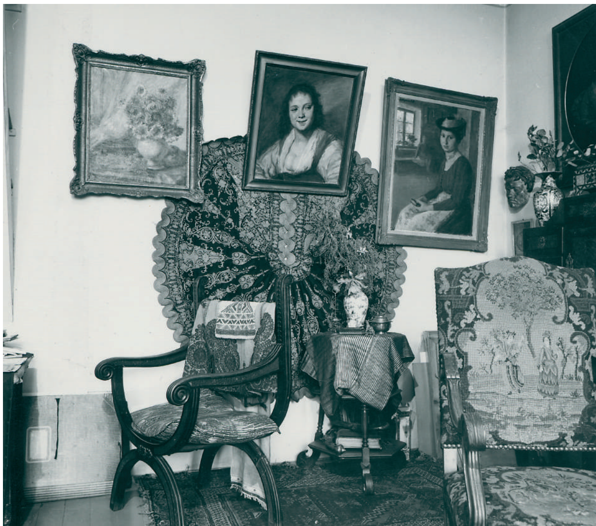
Слика 4. Атеље Бете Вукановић у Коларчевој задужбини, 1972.

Figure 4 Beta Vukanović's atelier in Kolarac Endowment, 1972