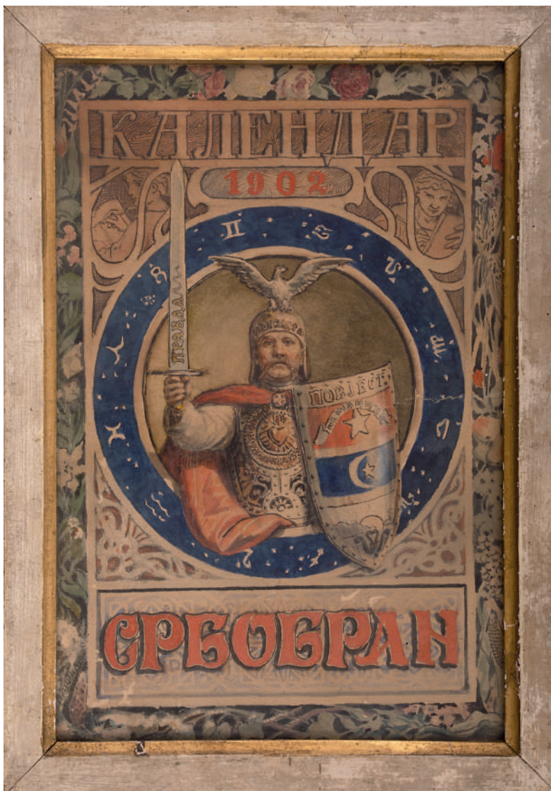
Figure 12 Uroš Predić, Cover page for the 1902 Srbobran Calendar , watercolour and gouache on paper, 16.7 x 24.5 cm, inv. LBV 253

стране Уроша Предића, који је настао у знак сећања на посету Ристе и Бете Вукановић Орловату, те представља важну визуелну меморију и спомен на вишегодишње пријатељство (сл. 12). О професионалној сарадњи Бете Вукановић и Уроша Предића сведочи и карикатура сликара коју је урадила у Орловату, приказаног у виду „донкихотске фигуре“, са светитељским ореолом и с копљем у рукама, из (око) 1910. године, данас у приватном власништву. 104