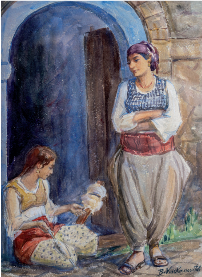
Слика 6. Бета Вукановић, Из Јужне Србије I , акварел, 27,5 x 38 cm, инв. ЛБВ 71