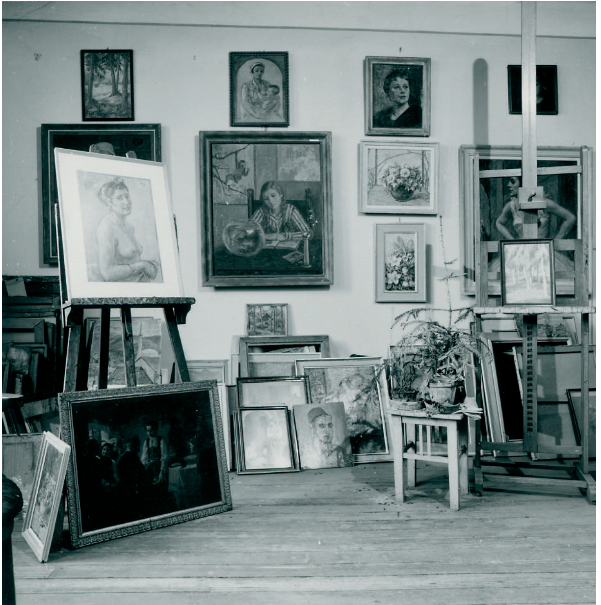
Слика 2. Атеље Бете Вукановић у Коларчевој задужбини, 1972.