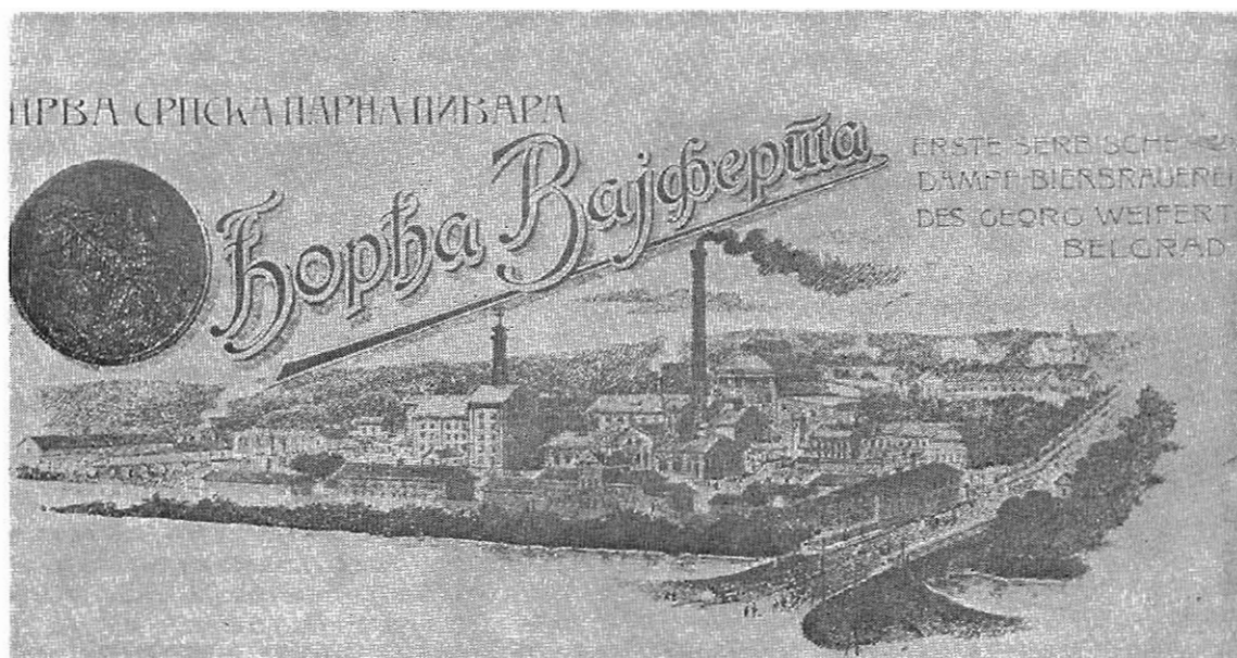
Заглавље за пословна писма, карте и рекламе пиваре Ђорђа Вајферта.

Letterhead paper for business correspondence, picture postcards and advertising material of the brewery of Dorde Vajfert.