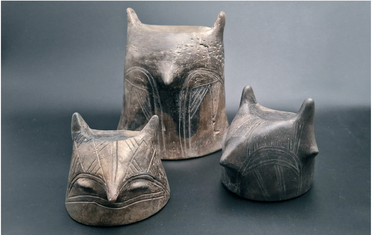
Слика 1. Просопоморфни поклопци са локалитета Усек на Бањици (Документациони центар Музеја града Београда)